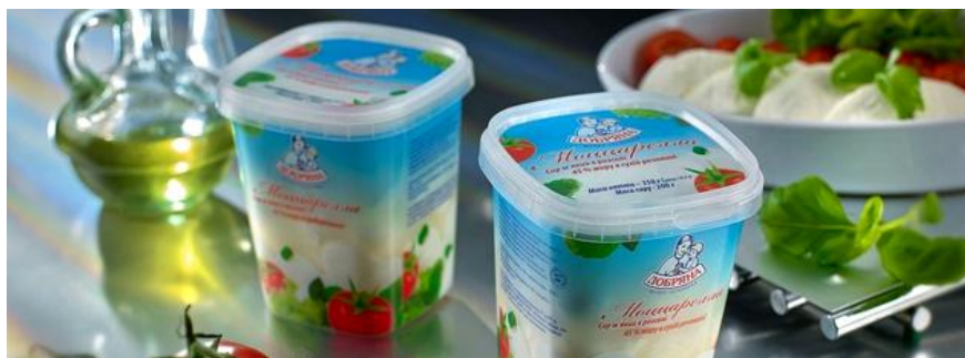
Da li posle kvota za plastične kese možemo od EU očekivati i kvote za broj litara jogurta po stanovniku godišnje, kako bi se smanjila količina jednokratne ambalaže?