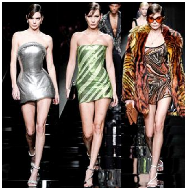
Modna industrija stalno lansira novu odeću koja je sve kratkotrajnija (detalj kolekcije Versacea sa modne revije Fashion Week, Milano)

Čovječanstvo će se morati ponovno naučiti na dulju uporabu i popravak proizvoda. To se prvenstveno odnosi na bijelu tehniku, sprave i spravice za digitalnu transformaciju. No, i na modu odjeće i obuće. Pritom treba naglasiti da produljenje uporabe proizvoda pretpostavlja i postojanje vještih popravljča. Koji su kao zvanje i zanimanje sve podcjenjeniji. Valja navesti neke primjere. Kada sam nedavno kupovao novu sudericu (stroj za pranje posuda), konstatirao sam da mi je postojeća trajala 18 godina. Garancija je tada bila tri godine. Nova ima garanciju od pet godina. No voditelj prodaje perilica rublja i posuda, tvrtke kod koje kupujem te proizvode još od 1965., rekao je jasno: „Ova, koju ste kupili, neće tako dugo trajati“. Sve dulji garantni rokovi, sve kraći vijek trajanja proizvoda. A oporabiti te strojeve nije jednostavni zadatak. Posebno u zemlji koja više nema ni jedne talionice ma-