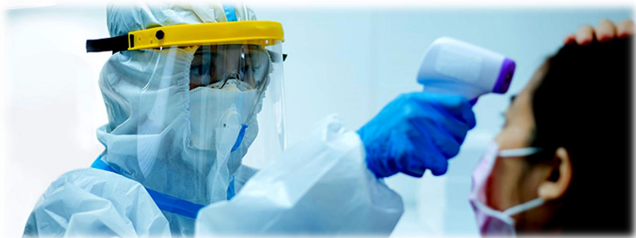
Na dan medicinskih sestara – pozdrav medicinskim sestrama na čelu borbe protiv COVID-19 (D. McKay)

matske promjene. Najbolji primjer su plastične vrećice. Koje te organizacije smatraju „najgorim proizvodom svih vremena“. Svi ih nastoje zabraniti, pa tako i u našoj sredini. Pandemija koronavirusa uz sve poteškoće koje je donijela čovječanstvu, mogla bi rezultirati renesansom trenutnog poimanja plastike. „Daily Express“ 18. svibnja 2020. piše: „Plastika je ta koja spašava živote tijekom ove zdravstvene krize. To ne treba demonizirati, pa nemojmo to demonizirati“. Sve dok Veliku Britaniju nije pogodio Covid-19, plastika je bila najveći negativac u borbi za čistiji okoliš. Sada su plastična oprema i odjeća bitni u zaštiti herojskih liječnika i medicinskih sestara. Zbog plastike, preciznije plastičnih proizvoda, hrana iz supermarketa postala je još higijenskija. Veliki dio toga je plastika za jednokratnu uporabu koja se odstranjuje po zadovoljenju svakodnevnih svrhe. Posljednjih dana sve učestalije pristižu vijesti povezane s koronavirusom, da je zabrana plastičnih vrećica štetna. U doba koronavirusa te iste plastične vrećice debljine od 15 do 50 mikrometara pokazale su se spasonosnima. Najnoviji primjer. Zakonodavci u saveznoj državi Maine izglasali su 17. ožujka 2020. odgodu primjene državne zabrane plastičnih vrećica, kao dio većeg paketa hitnih mjera čiji je cilj usporavanje širenja pandemije koronavirusa. Nekoliko dužnosnika u drugim državama, uključujući vrhovnog republikanca u državnom Senatu New Yorka, zagovaraju sličnu akciju.