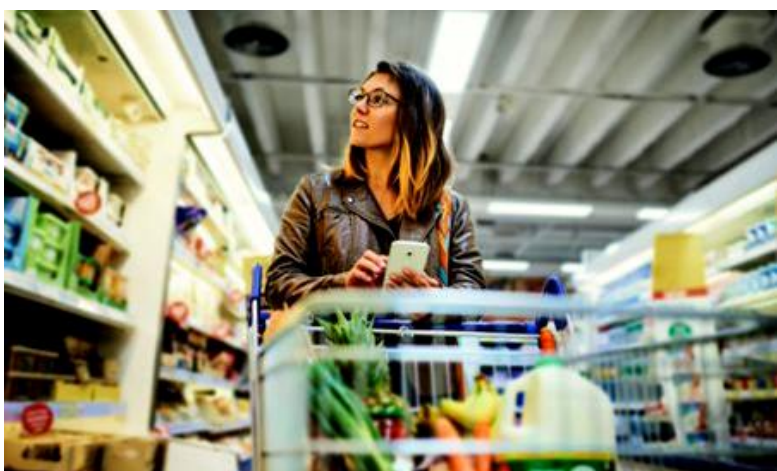
Veliki trgovački lanci preuzeli su gotovo kompletno snabdevanje hranom i drugim potrepštinama, što zahteva sve više ambalaže

mobilske industriji, građevinarstvu, zdravstvu, kozmetici, energetici, elektronicima, sportu i slobodnom vremenu«. Zaključak, pred automobilskom industrijom su ponajveći izazovi suvremenog društva. S jedne strane što veća i snažnija vozila s minimalnim emisijama ispušnih plinova. Koje je moguće uključiti u kružno gospodarstvo. S druge strane, odakle parkirna mjesta. Jedno je od rješenja, sigurno, smanjivanje vlastitih osobnih vozila na račun iznajmljivanja. Još jedan podatak privlači pozornost. EU kažnjava automobile, a nagrađuje brodove. Premda najviše zagađuju. U devet od deset analiziranih zemalja brodovi su ispuštali više CO 2 od automobila. A dobili su dotacije od 24 milijarde eura.