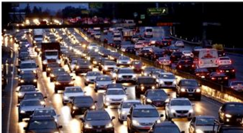
Nepregledne kolone automobila na ulicama Los Angelesa