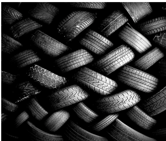
Finalni proizvodi od umreženog kaučuka

umrežavanja može da se poveća dodatkom organskih ubrzivača kao što je npr. etilen-tiourea.