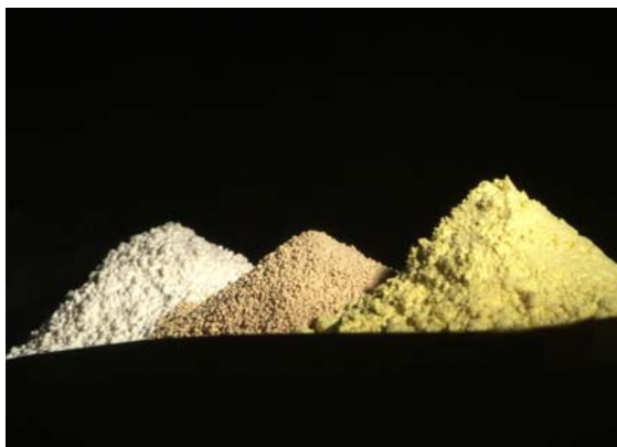
Sastojci kaučukove smese

NBR vulkanizati dobijeni korišćenjem sumpora ne odlikuju se dobrom toplotnom otpornošću, te