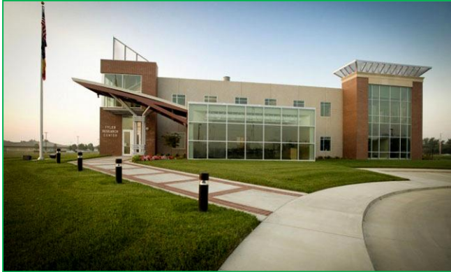
Kansas Polymer Research Center na PSU

Polimerni beton se tradicionalno koristi kao podni materijal po ustanovama, bolnicama i industrijskim objektima, jer se lako održava. Glavna komponenta je neorgansko punilo i 5–10% polimernog veziva. Mi smo kao vezivo koristili poliuretane na bazi biljnih ulja. Dobijeni materijal je nekoliko puta čvršći od neorganskog betona, estetski privlačniji, brzo očvršćavajući i oko četiri puta skuplji. S jednom građevinskom firmom razvili smo verziju koja je upola manje specifične težine za zidne ploče. Ovde polimer nije aditiv, već vezivna komponenta.