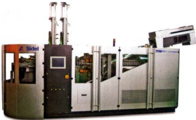
Nova linija firme Sidel za proizvodnju boca od 9,9 g, odnosno, tipa "NoBottle"

Konkurent iz Italije, firma Sipa, predstavila je najnoviji model rotacione mašine za duvanje, tip "SFR 12 EVO", koji je rezultat najnovijeg razvoja mašine lansirane 1999. godine. Kako navode u kompaniji, model ima poboljšane karakteristike, manju potrošnju energije, niže troškove održavanja i povećanu fleksibilnost.