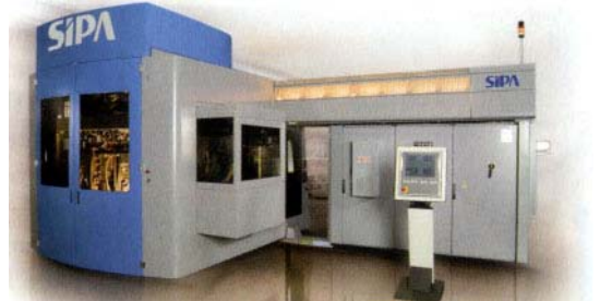
Linija firme Sipa "SFR 12 EVO" za kapacitete 1.800-2.000 boca na čas

Pored velikog razvoja u oblasti dizajna boca, posebno kod formiranja održive ambalaže sa bocama male težine izrađenih od poli(laktidne kiseline) – PLA, firma Sidel je promovisala dodatke za svoju liniju "SBO", kao i novi softver za praćenje i kontrolu procesa duvanja, pod nazivom "Equinox". Novo rešenje boce za vodu od 500 ml firme Sidel, "NoBottle", teži samo 9,9 g u poređenju sa sličnom ambalažom koja je teška 13-16 g. Sidel proizvodi ovu bocu na svojoj novoj liniji "SBO 24xs Highspeed", a istovremeno nastavlja sa ekološki podobnom bocom od 10 litara za jestivo ulje, koja je izrađena od PLA i teži 140 g.